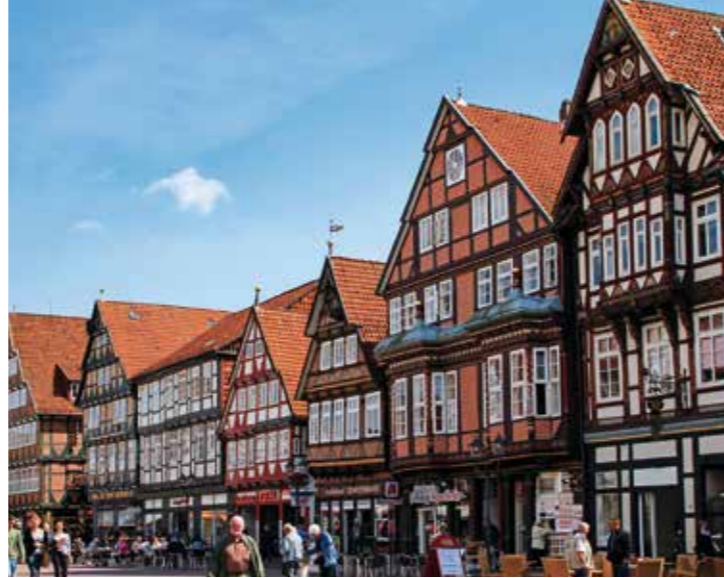
Fachwerkhäuser in der Celler Altstadt