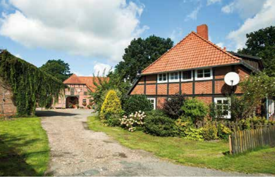
Alter Fachwerkhof in Bröckel