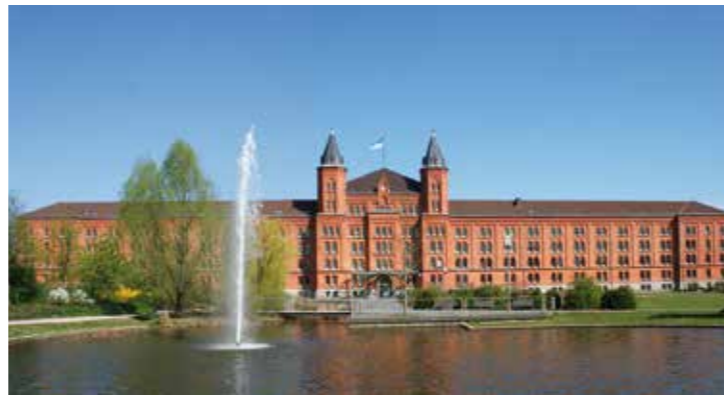
Neues Rathaus in Celle

auf dem Dach der Martinskirche 2 beobachten. Hinter Ehlershausen gibt es die Möglichkeit, über Wathlingen mit der St. Marienkirche und ihrem Fachwerkturm, die Tour bis Eicklingen abzukürzen. Ansonsten führt die Route weiter nach Otze 3, das zum Besuch einlädt: Im Kapellenweg versteckt sich eine Backstein-Kapelle mit hölzernem Glockenturm. Mit ihrer reich verzierten Holzdecke und dem Flügelaltar zählt sie zu den ältesten Sakralbauten der Gegend. Das Backhaus in der Straße „Am Speicher“ stammt aus dem 17. Jahrhundert und wird heute als stimmungsvoller Ort für Eheschließungen genutzt. Wir radeln vorbei an der Sorgenser Bockwindmühle 4, die 1686 errichtet wurde. In Burgdorf erwartet uns das Schloss 5, ein Fachwerkbau aus dem Jahr 1643. Eine Vielzahl von Häusern in der Innenstadt, das Rathaus und das Stadtmuseum (geöffnet: Sa-So, 14-17 Uhr) sind ebenfalls im Fachwerkstil erhalten. Über die Straße „Am Brandende“ führt der Radweg an der Bockwindmühle von Hänigsen vorbei. Ein Abstecher zu den Uetzer Spree-waldseen 6 sorgt für Erfrischung (Bademöglichkeit am Irenensee). In Bröckel erwarten uns charmante Fachwerkhäuser 7. In Eicklingen befindet sich der repräsentative Amtshof 8, der früher dem Amtsvogt als Verwaltungssitz diente. Endlich erreichen wir das Kloster Wienhausen 9, ein Juwel norddeutscher Backsteingotik. Im Jahr 1225 gegrün-