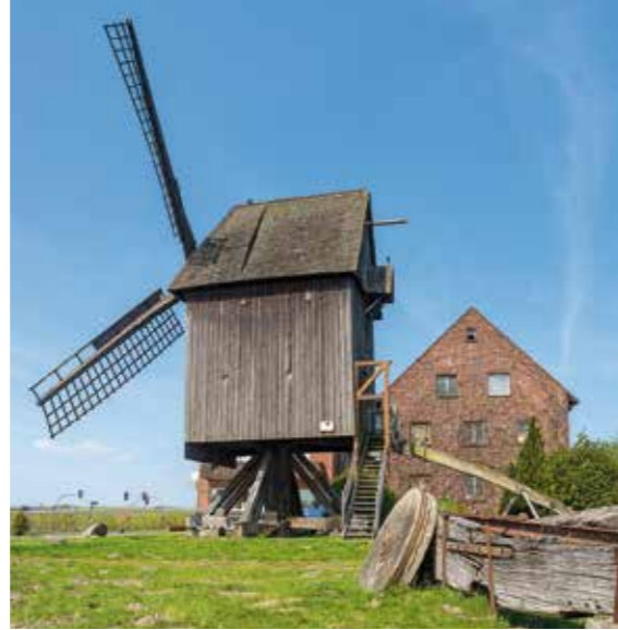
Sorgenser Mühle