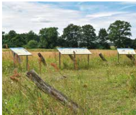
„Natur-Erleben“-Projekt in Osterloh

auf dem Dach der Martinskirche 2 beobachten. Hinter Ehlershausen gibt es die Möglichkeit, über Wathlingen mit der St. Marienkirche und ihrem Fachwerkturm, die Tour bis Eicklingen abzukürzen. Ansonsten führt die Route weiter nach Otze 3, das zum Besuch einlädt: Im Kapellenweg versteckt sich eine Backstein-Kapelle mit hölzernem Glockenturm. Mit ihrer reich verzierten Holzdecke und dem Flügelaltar zählt sie zu den ältesten Sakralbauten der Gegend. Das Backhaus in der Straße „Am Speicher“ stammt aus dem 17. Jahrhundert und wird heute als stimmungsvoller Ort für Eheschließungen genutzt. Wir radeln vorbei an der Sorgenser Bockwindmühle 4, die 1686 errichtet wurde. In Burgdorf erwartet uns das Schloss 5, ein Fachwerkbau aus dem Jahr 1643. Eine Vielzahl von Häusern in der Innenstadt, das Rathaus und das Stadtmuseum (geöffnet: Sa-So, 14-17 Uhr) sind ebenfalls im Fachwerkstil erhalten. Über die Straße „Am Brandende“ führt der Radweg an der Bockwindmühle von Hänigsen vorbei. Ein Abstecher zu den Uetzer Spree-waldseen 6 sorgt für Erfrischung (Bademöglichkeit am Irenensee). In Bröckel erwarten uns charmante Fachwerkhäuser 7. In Eicklingen befindet sich der repräsentative Amtshof 8, der früher dem Amtsvogt als Verwaltungssitz diente. Endlich erreichen wir das Kloster Wienhausen 9, ein Juwel norddeutscher Backsteingotik. Im Jahr 1225 gegrün-