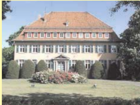
Oben: Die Magdalenenkapelle ist der Blickfang des alten Friedhofes neben der Hochbrücke. Unten: In der ehemaligen Landratsvilla, heute Rathaus II, arbeitet die Stadtverwaltung.