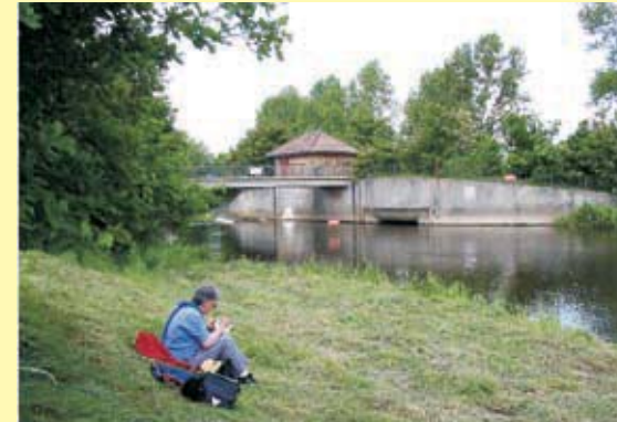
Oben: Allerwehr bei Osterloh; unten: Heilkräutergarten