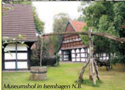
Museumshof in Isernhagen N.B.