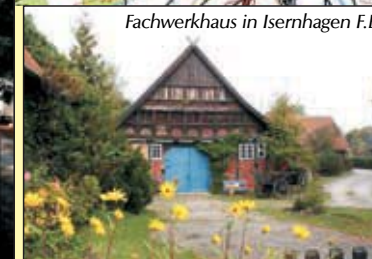
Fachwerkhaus in Isernhagen F.B.